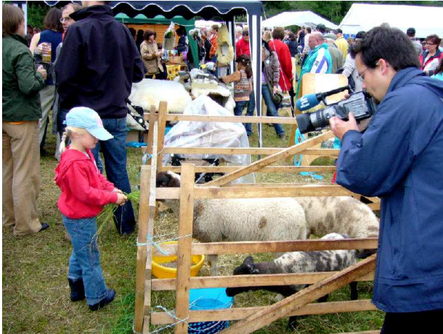
Begegnungen zwischen Menschen und Tieren

Eine komplette Schafherde wird durch den Ort auf die Weide getrieben.